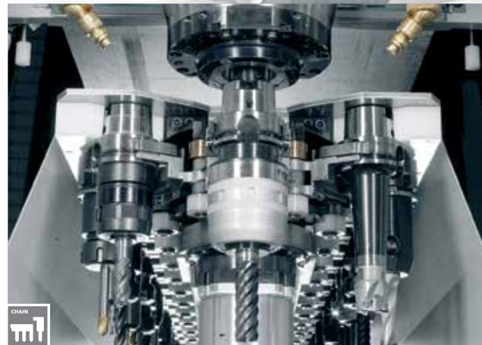
Automatischer Werkzeugwechsel im Pick-up-Verfahren ab 1,5 s (40 Werkzeugplätze)