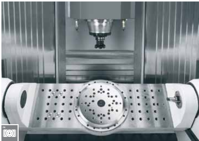
2-Achs-Schwenkrundtisch für die wirtschaftliche Komplettbearbeitung mit 5 simultan gesteuerten Achsen.