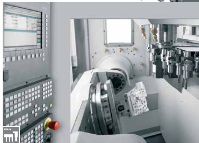
Changement d'outil automatique en mode pick-up à partir de 0,9 seconde (48 emplacements)