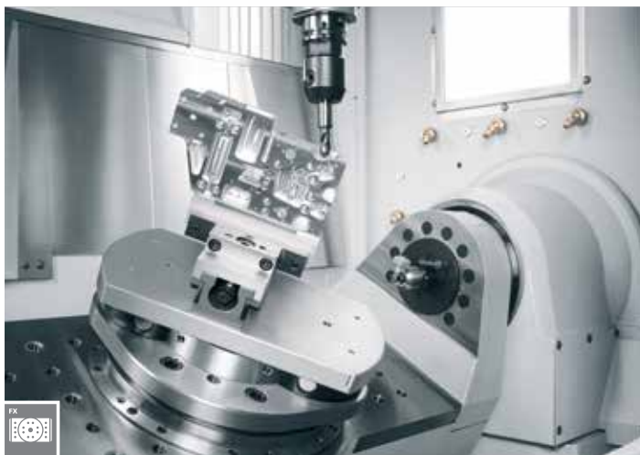
Diviseur pivotant 2 axes pour l'usinage économique complet sur 5 axes.